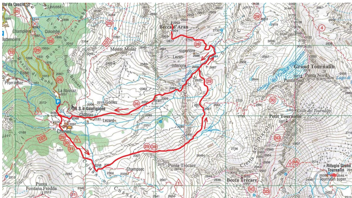
(Stralcio da "Carta dei sentieri n.7 – Valtournenche, 1:25.000 – L'Escursionista Editore")

In base alle tempistiche e alle condizioni fisiche dei partecipanti, a giudizio degli accompagnatori di AG, si scenderà lungo il sentiero di salita (it. 29) o lungo il sentiero che percorre il lato destro orografico del vallone (it. 26 - itinerario con tratti di sentiero più impegnativo ).